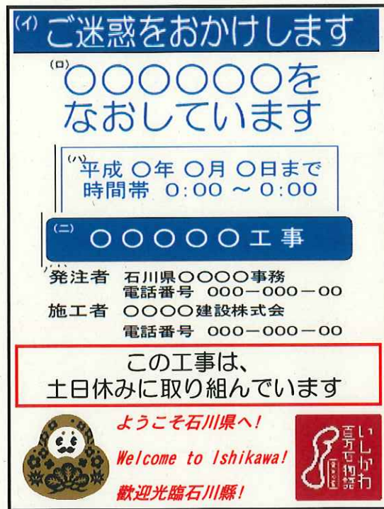
ひゃくまんさん仕様工事看板